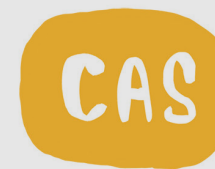
SENTRO NG MGA TUMUTULONG SA MGA GUMAGAMIT NG MGA BAWAL NA GAMOT